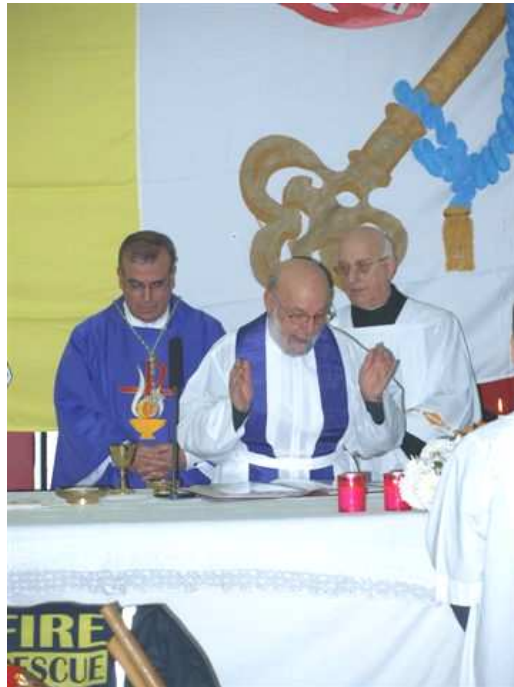
Mons Arcisqof fuq wara

Nittamaw li hafna aktar diletanti tar-radju jithajjru joffru s-servizz taghhom aktar 'il quddiem meta l-affarijiet ikunu mxew u nittamaw li jkun hemm grupp f'kull belt u rahal f'Malta li jkunu lesti joffru s-servizz taghhom jekk tinqala' l-htiega.