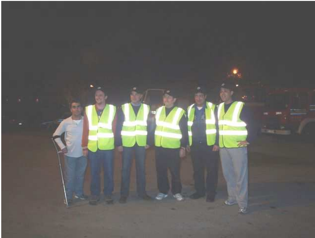
9H1SF, 9H1PI, 9H1AA, 9H1VW, 9H1M, 9H1PS

Kien hemm ukoll preżentazzjoni fuq monitor minn 9H1M dwar attivitajiet ta' protezzjoni ċivili f'pajjiżi oħra li serviet ukoll ta' tagħrif dwar hidmiet bħal dawn u kif isiru barra minn Malta.