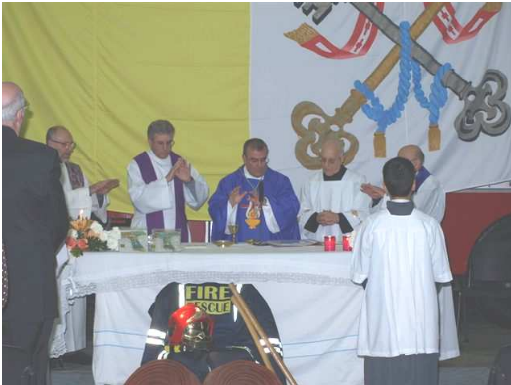
Mons Arcisqof Pawlu Cremona waqt il-quddiesa