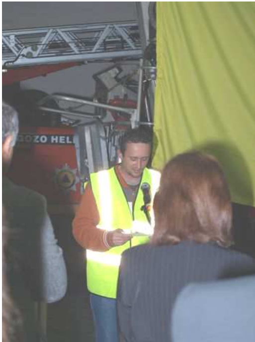
9H1PI jaqra talba