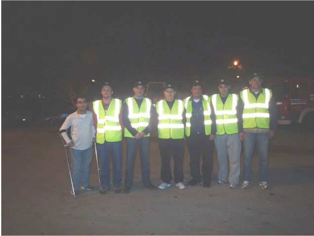
9H1SF, 9H1PI, 9H1AA, 9H1VW, 9H1M, 9H1PS, 9H5SN