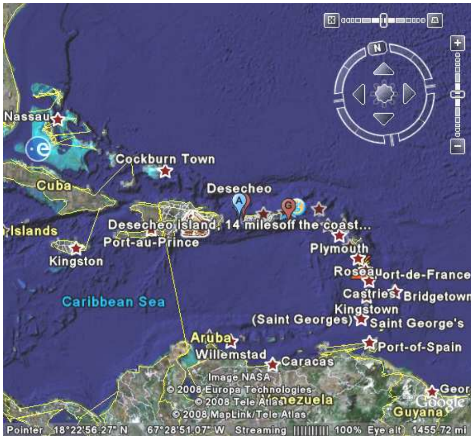
Desecheo hija mmarkata bl-ittra A blu