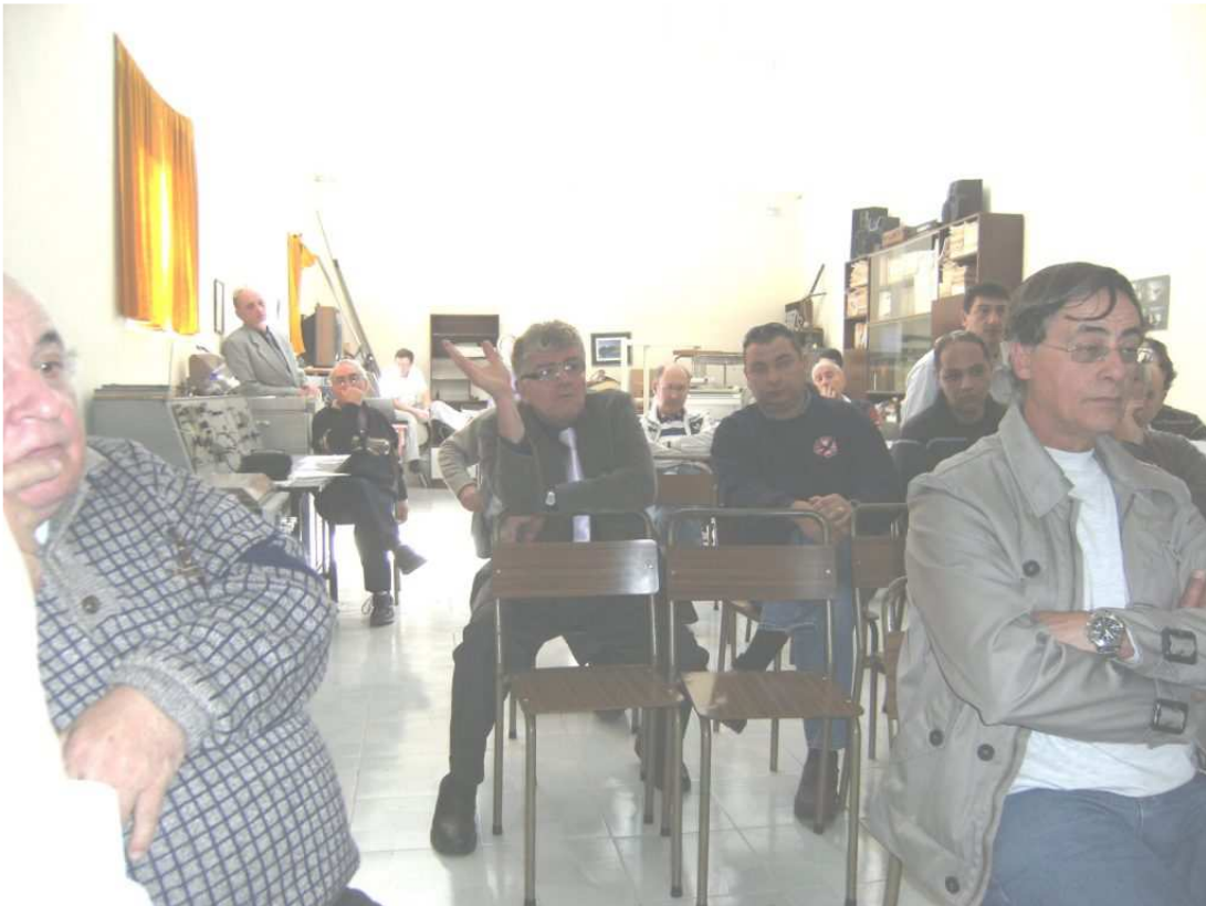
Ritratti 9H1AV, 9H9MHR